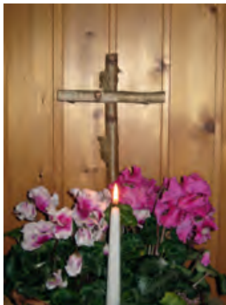
Obiges Foto: Dagmar Weber