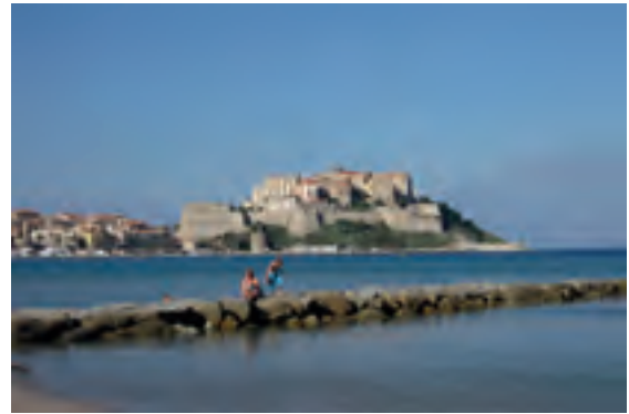
Zitadelle von Calvi