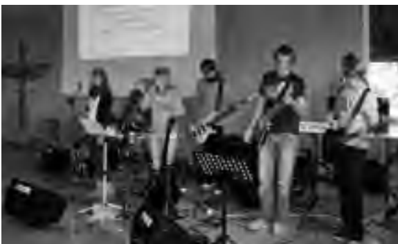
1. Das Lobpreisteam ETERNITY : 7 Jugendliche aus

Mit Vorfreude im Herzen machte ich mich auf den Weg nach Herrenberg und konnte feststellen: „es hat sich wirklich sehr gelohnt“! Es gab für mich etliche Überraschungen: